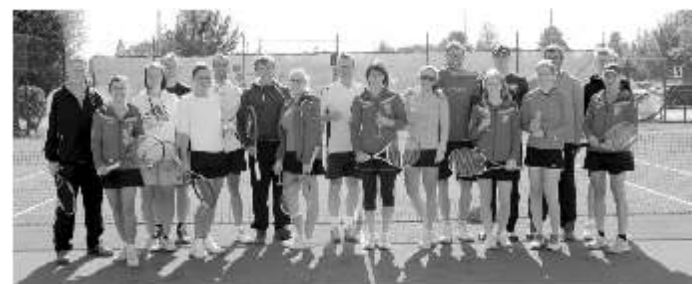
Alle Teilnehmer des Mixed-Turniers genossen den spaßigen Saisonabschluss